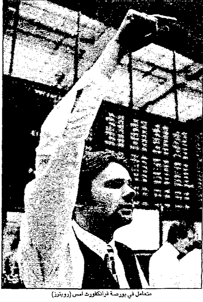
متمثل في بورصة فرانكفورت أمس

تعزيز اقتصادها. وقال محللون من محاولات المسؤولين اليابانيين للحد من تلك التكهات لم يكن لها تأثير كبير على قوة الدولار. وفي بورصة لندن، شهد مؤشر Nikkei الياباني ارتفاعاً ملحوظاً، مدفوعاً بتوقعات اقتصادية إيجابية في اليابان. كما شهدت بورصة هونغ كونغ ارتفاعاً قوياً، مما يعكس ثقة المستثمرين في الاقتصاد الصيني. وتوقعت الشركات الآسيوية أداءاً قوياً في الربع الأول من عام 1998، مما ساهم في ارتفاع أسعار الأسهم.